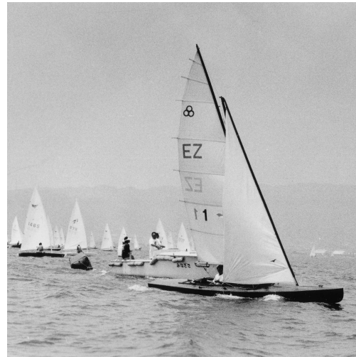
1975年BKRスタートシーン(ゲートスタート実施)

夏休みの最後に、ご家族や友人とのセーリングを楽しみませんか。日ごろの練習の成果を発揮するとともに、世代を超えたセーラー同士の懇親の場としていただければ幸いです。